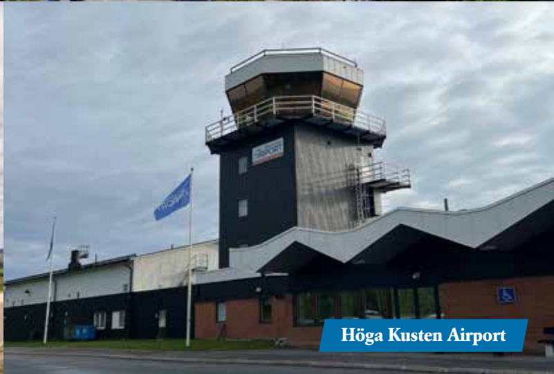
Höga Kusten Airport