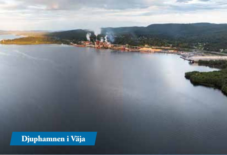
Djuphamnen i Väja